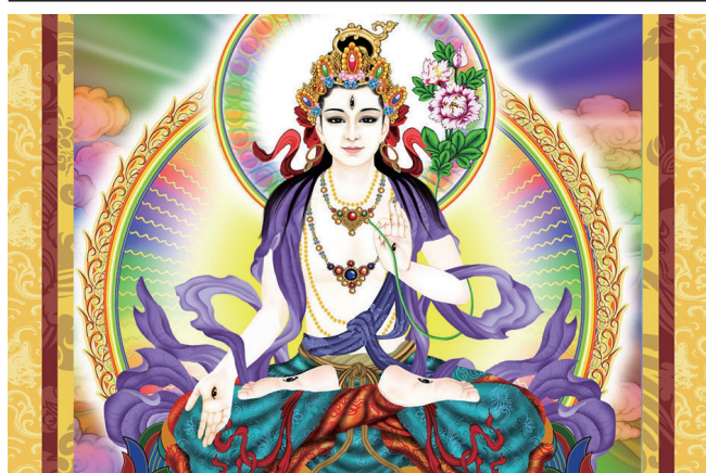
06 Sita Tara Bhagavati (Tara Putih)