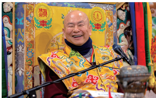
04 Interaksi Adalah Kekuatan