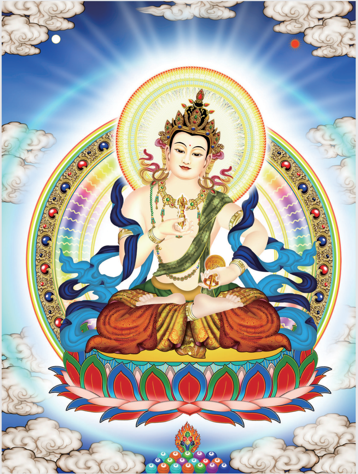
南摩金剛薩埵 Ná Mó Jīn Gāng Sà Duǒ