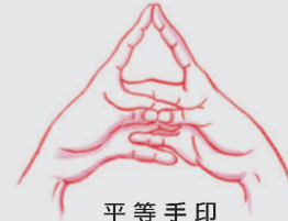
平等手印 Píng děng shǒu yìn

Yòng shǒu yìn yì yī chù tiān xīn sǎn yìn