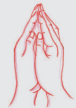
佛龕手印 Fó kān shǒu yìn