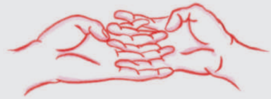
大海超渡手印 Dà hǎi chāo dù shǒu yìn

Jiā mí nì Jiā jiā nà Zhǐ duō jiā lì Sō hà