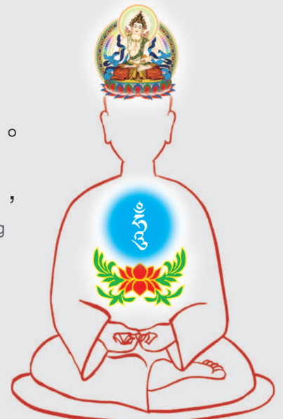
入我觀 Rù wǒ guān