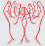
蓮花手印 Lián huā shǒu yìn