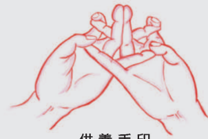
供養手印 Gòng yǎng shǒu yìn

Yòu dà mǔ zhǐ àn zuǒ xiǎo zhǐ jié yìn zhì xiōng qián