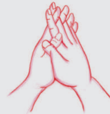
金剛合掌手印 Jīn gāng hé zhǎng shǒu yìn

Pǔ lǐ yí qiè hù fǎ jīn gāng hù fǎ lóng tiān