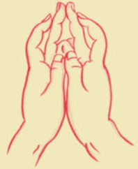
準提佛母根本印 Zhǔn tí fó mǔ gēn běn yìn

Zhǒng zǐ zì ( Bái huáng sè ( Zhǔn ) zì fàng qiǎn huáng guāng )