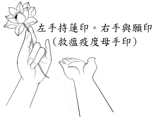
左手持蓮印。右手與願印 (救瘟疫度母手印)